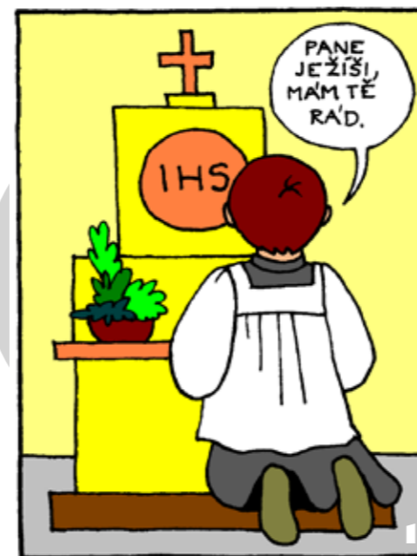
OTČE NÁŠ, JENŽ JSI NA NEBESÍCH, POSVĚT SE JMÉNO TVÉ,