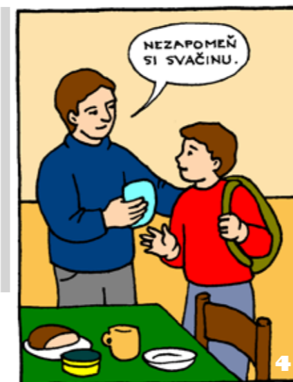
CHLĚB NÁŠ VEZDEJŠÍ DEJ NÁM DNES