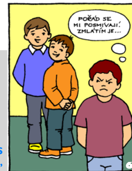
A NEUVEĎ NÁS V POKUŠENÍ,