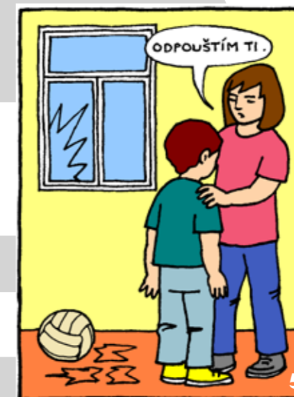
A ODPUŠŤ NÁM NAŠE VINY, JAKO I MY ODPOUŠTÍME NAŠIM VINÍKŮM