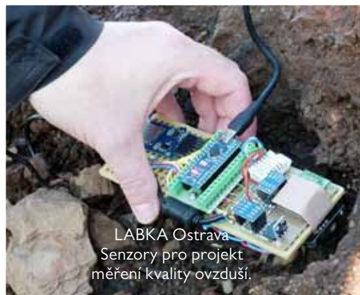
LABKA Ostrava. Senzory pro projekt měření kvality ovzduší.