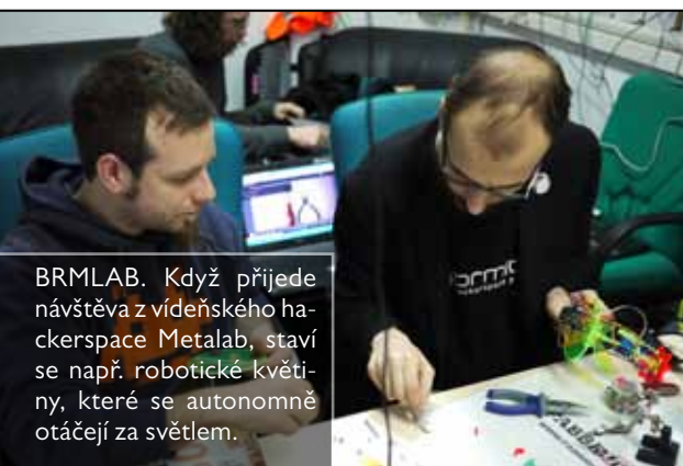
BRMLAB. Když přijede návštěva z vídeňského hackerspace Metalab, staví se např. robotické květiny, které se autonomně otáčejí za světlem.

Razzy: Projevuje lásku k technologiím, nekonvenčnímu myšlení a touhu budovat.