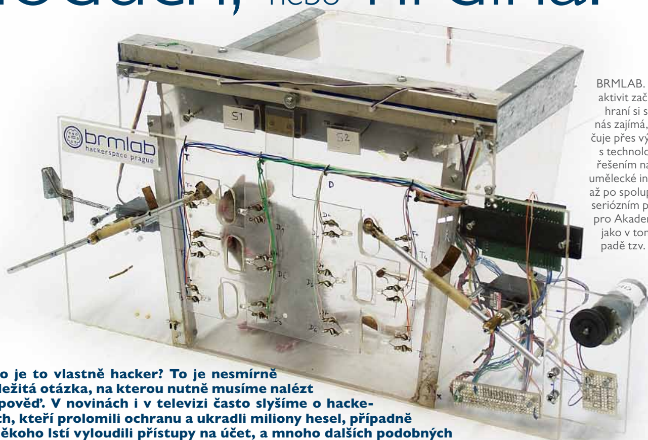
BRMLAB. Většina aktivit začíná jako hraní si s tím, co nás zajímá, pokračuje přes výpomoc s technologickým řešením např. pro umělecké instalace, až po spolupráci na seriózním projektu pro Akademii věd, jako v tomto případě tzv. skinner boxu.

Kdo je to vlastně hacker? To je nesmírně důležitá otázka, na kterou nutně musíme nalézt odpověď. V novinách i v televizi často slyšíme o hackerech, kteří prolomili ochranu a ukradli miliony hesel, případně z něhoho lstí vyloudili přístupy na účet, a mnoho dalších podobných zpráv. Odvažují se ale tvrdit, že to všechno je práce chytřejších zlodějů a hackeři s tím nemívají nic společného.