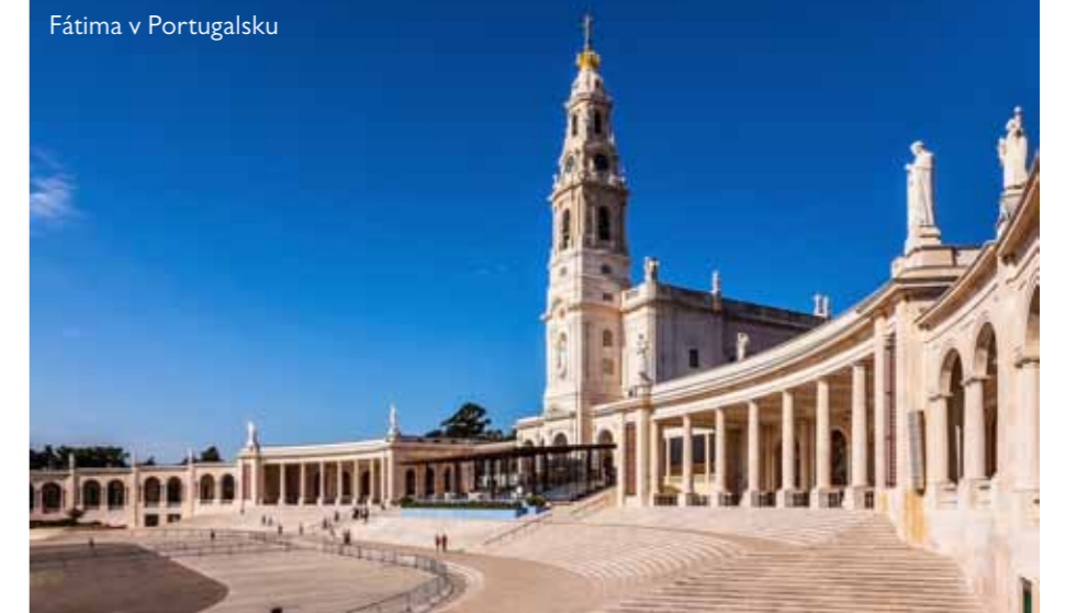
Fátima v Portugalsku