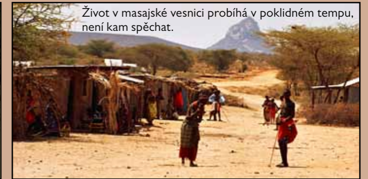
Život v masajské vesnici probíhá v poklidném tempu, není kam spěchat.