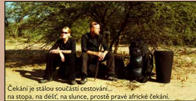
Čekání je stálou součástí cestování... na stopa, na déšť, na slunce, prostě pravé africké čekání.

Více v dobrodružném cestopisu Cesta k branám Damašku Východní Afriky.