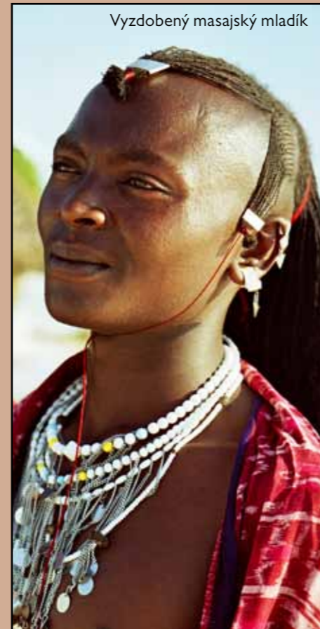
Vyzdobený masajský mladík

s Masaji jen tu nejlepší zkušenost. Ti na Zanzibaru byli velmi přátelští a také Sikólie nás vítali, ale teď přicházíme k vesnici, kde může svou roli sehrát strach z ve-třelců. Kráčíme proto pomalu a čekáme, až si nás někdo všimne. Za pár minut už slyšíme dětský křik. S malými dětmi k nám přichází asi patnáctiletá dívka, která nás vítá slušnou angličtinou. Vida, mezi Masaji se domluvíme. Dívka nás zve do vesnice. Obcházíme starší Masaje a vítáme se stiskem ruky. Potom jsme usazeni k velkému ohništi na plácku mezi chýšemi. Chýše mají