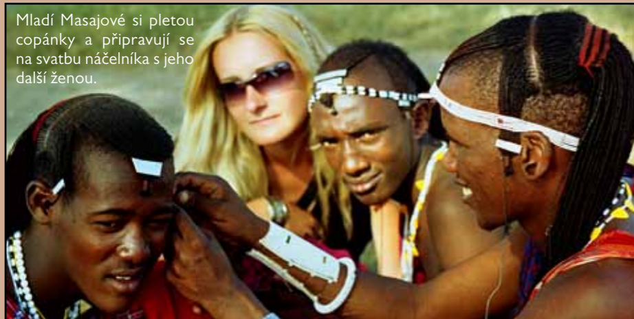
Mladí Masajové si pletou copánky a připravují se na svatbu náčelníka s jeho další ženou.

Jakmile se slunce dotklo obzoru, spatřili jsme první masajskou vesnici. Zatím máme