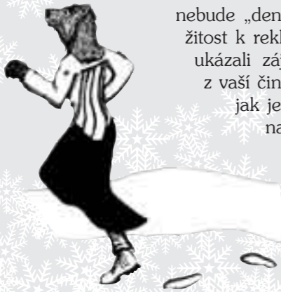
Ilustrace Dominik Strnad

A sledovali jste někdy už ve sněhu medvěda? Že ne? Tak nyní si to můžete vyzkoušet. Jeden hráč odejde (nejlépe do lesa) a ostatní ho sledují asi se čtvrthodinovým zpožděním. Protože ho nevidí, mohou se řídit pouze podle jeho stop ve sněhu.