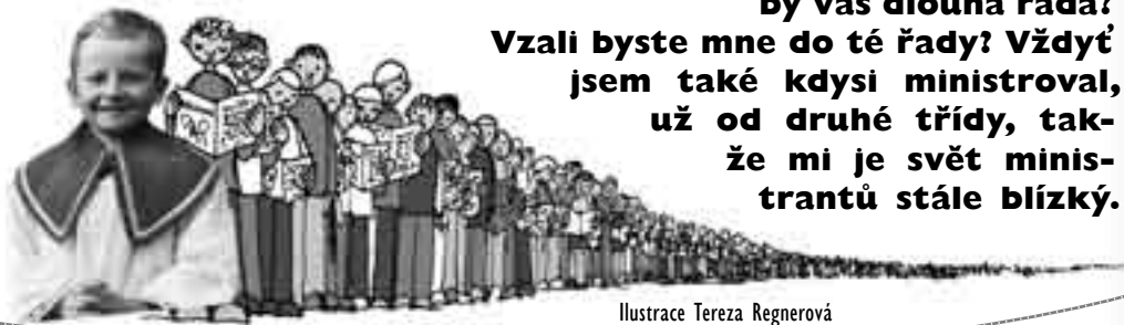
Ilustrace Tereza Regnerová

Vzali byste mne do té řady? Vždyť jsem také kdysi ministroval, už od druhé třídy, takže mi je svět ministrantů stále blízky.