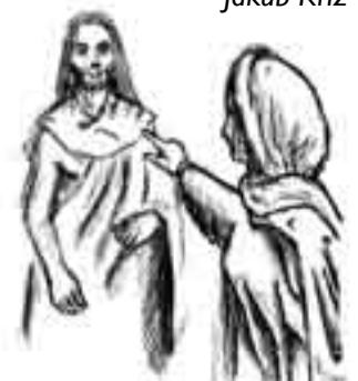
Ilustrace Dominik Strnad