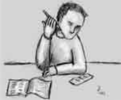
Ilustrace Dominik Strnad

Náklady na zaslání jednoho výtisku časopisu na jednu adresu šestkrát ročně jsou 144 Kč.