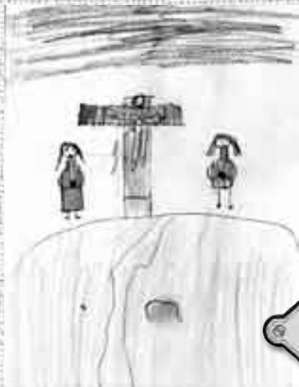
Roman Kubů Ukřižování