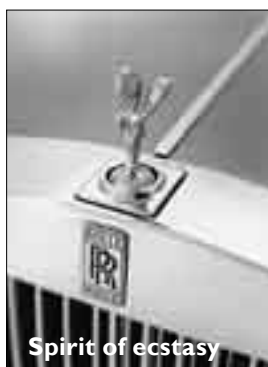
Spirit of ecstasy