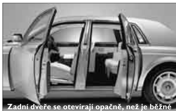
Zadní dveře se otevírají opačně, než je běžné