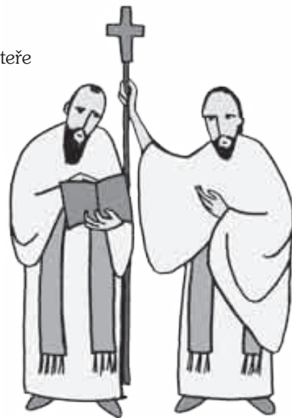
Ilustrace Jana Regnerová

Abys získal patnáctý bod, napiš přesné datum smrti obou světců.