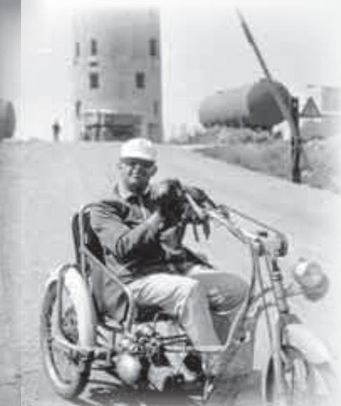
▼ Důmyslný vozík pomáhal manželovi dostat se kamkoliv