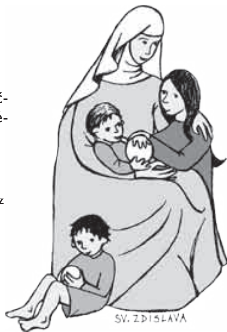
Ilustrace Jana Regnerová