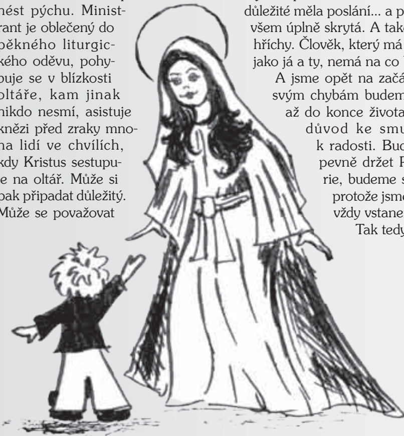
Ilustrace Libuše Mocová

Je možné, že se někdy stane, že se budeš považovat za lepšího, než jsou tvoji kamarádi. Být ministrantem je velká čest a důstojná služba, která však s sebou může přinést pýchu. Ministrant je oblečený do pěkného liturgického oděvu, pohybuje se v blízkosti oltáře, kam jinak nikdo nesmí, asistuje knězi před zrakou mnoha lidí ve chvílích, kdy Kristus sestupuje na oltář. Může si pak připadat důležitý. Může se považovat