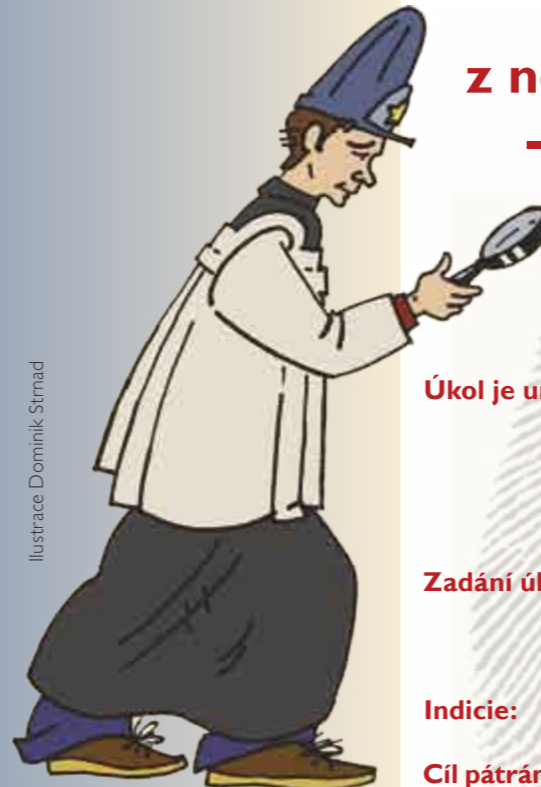
Ilustrace Dominik Strnad

Po jedné z nejcennějších věcí – po informaci