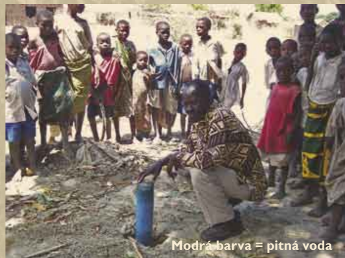
Modrá barva = pitná voda