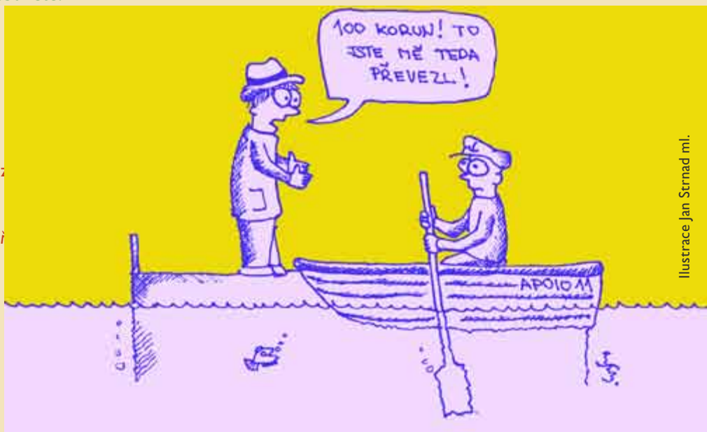
Ilustrace Jan Štrnad ml.