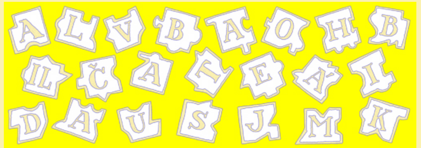
Stránku připravila Iva Fukalová

Skládanka má 22 dílků složených do dvou řádků. Když je správně složíš, vyjde ti tajenka.