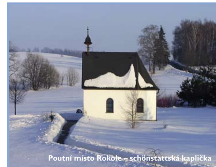
Poutní místo Rokole – schönstattska kaplička

Až se v klášteře rozloučíte, určitě pak seběhnete kousek níž k silnici. Tam stojí v hájku starý kostel. A pod ním teče zázračná studánka, ze které se můžete napít. Podle legendy zabloudilo v roklinách (a proto je to asi Rokole) zdejších hlubokých lesů děvčátko. Prošlo o pomoc Pannu Marii. Ta se jí zjevila a vyvedla ji za ruku z lesa ven. V místě zjevení vytryskl pramen a zrodila se studánka. Nevím sice, jestli se to tak opravdu stalo, ale vím od místních, že ve studánce voda nevyschla ani v největších tropických vedrech. A to tedy zážrak je!