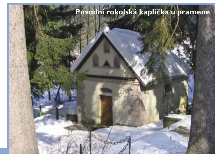
Původní rokolská kaplička u pramene