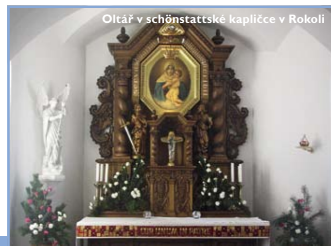
Oltář v schönstattske kapličky v Rokoli