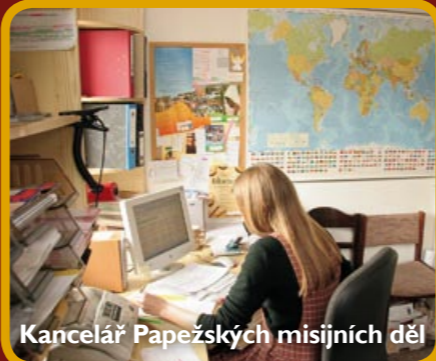
Kancelář Papežských misijních děl