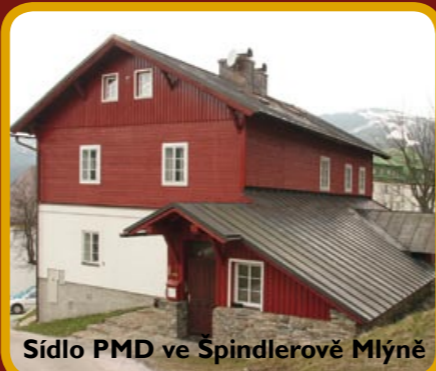
Sídlo PMD ve Špindlerově Mlýně