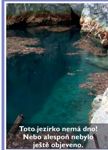
Toto jezírko nemá dno! Nebo alespoň nebylo ještě objeveno.

Nejhlubším místem naší republiky je jednoznačně Hranická propast na Moravě. Suchá část propasti sice měří pouhých 70 m, ale na jejím dně je jezírko měřící zatím asi 290 metrů. Proč zatím? Odhaduje se, že skutečná hloubka propasti může být více než dvakrát větší, zhruba 700 m. Potápěči však šachty Hranické propasti doposud prozkoumali jen do hloubky 290 m. V porovnání s Mariánským příkopem je sice hloubka Hranické propasti zanedbatelná, i tak je ale tato hlubina největší propastí střední Evropy.