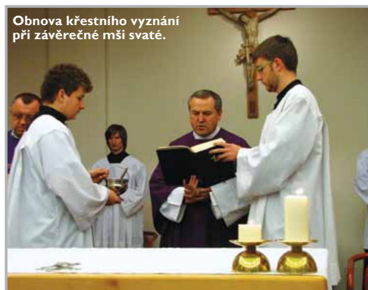
Obnova křestního vyznání při závěrečné mši svaté.