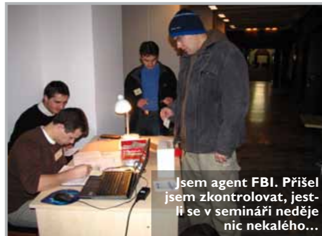
Jsem agent FBI. Přišel jsem zkontrolovat, jestli se v semináři neděje nic nekalého...