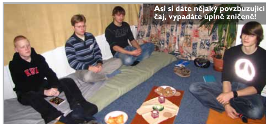
Asi si dáte nějaký povzbuzující čaj, vypadáte úplně zničeně!