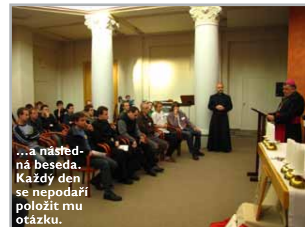
...a následná beseda. Každý den se nepodaří položit mu otázku.