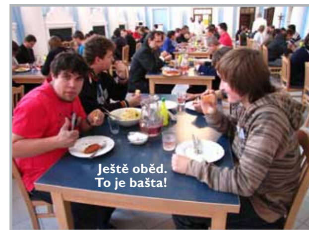
Ještě oběd. To je bašta!