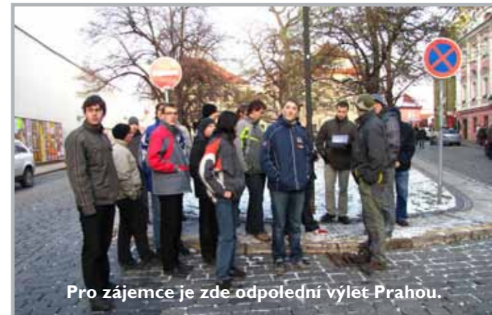
Pro zájemce je zde odpolední výlet Prahou.