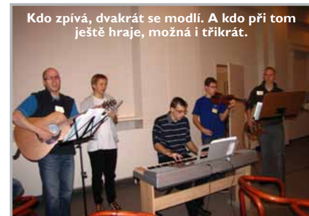
Kdo zpívá, dvakrát se modlí. A kdo při tom ještě hraje, možná i třikrát.