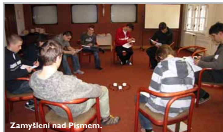
Zamyšlení nad Písmem.