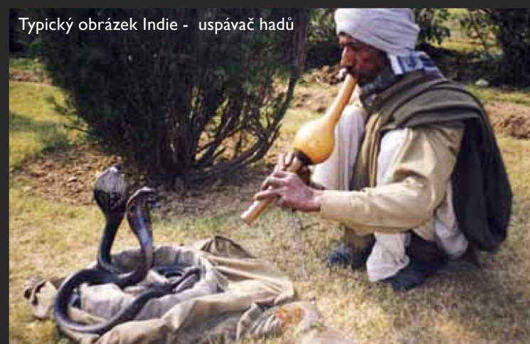
Typický obrázek Indie - uspávač hadů