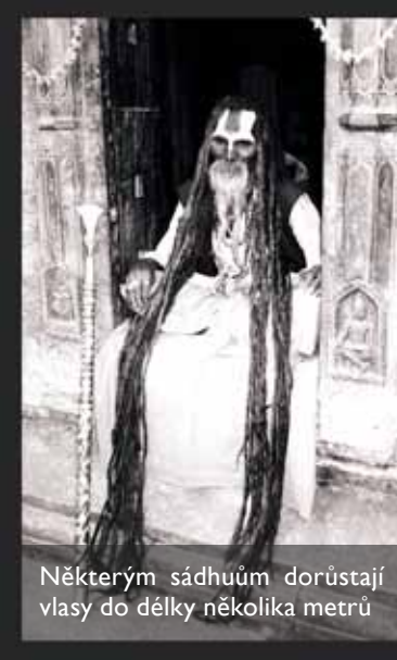
Některým sádhuům dorůstají vlasy do délky několika metrů