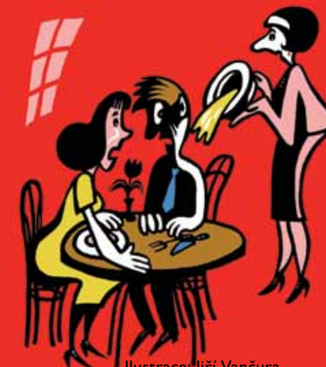
Ilustrace: Jiří Vančura