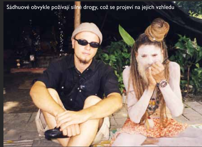
Sádhuové obvykle požívají silné drogy, což se projeví na jejich vzhledu