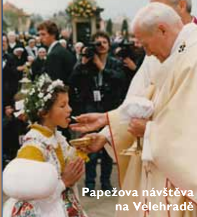
Papežova návštěva na Velehradě