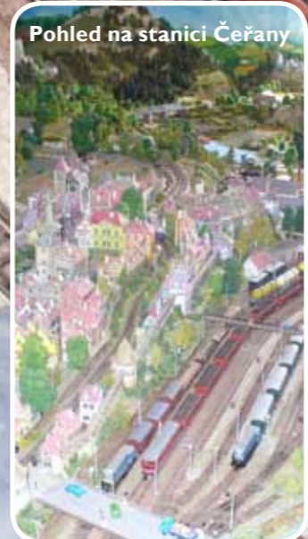
Pohled na stanici Čeřany