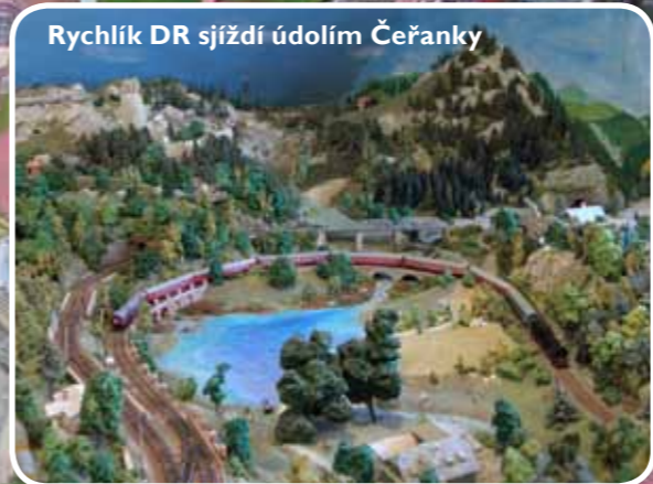
Rychlík DR sjíždí údolím Čeřanky

ZEPTALI JSME SE TVŮRČŮ KOLEJIŠTĚ: 1. Hráli jste si jako malí s vláčky? Kde jste viděli první model kolejiště? Jako malí kluci všichni! První modelové kolejiště viděl nejstarší člen při studiích v Brně v roce 1967 v klubu brněnských železničních modelářů a ostatní při návštěvách různých výstav podle věku. 2. Co bylo hlavním impulzem pro stavbu kolejiště? Co bylo impulzem? Postavit si kolejiště tak velké, aby si na něm mohli tři „chlapi“ jezdit s modely jako na skutečné železnici. Myslíme, že se nám to i podařilo. Jeden si může jen „šibovat po stanicích“ nebo si jezdit po lokálce. Sám je ztracený. 3. Co vás při stavbě nejvíc potrápilo? Dokončení stavby modelu závodu dřevařské pily, na který jsme neměli vhodnou předlohu, a tak jsme byli nuceni použít známých velkých pil v našem okolí, u kterých jsme museli vypustit všechny objekty a haly, které nebyly nutné pro její provoz. Dokončení pily trvalo celých 6 let. 4. Kolik lidí se na realizaci podílí? Stavbu realizovali tři lidé a dva poradci. V současné době provoz udržuje jeden. Při výstavě kolejiště se musíme domluvit, kdy a kdo se bude na provozu podílet. 5. Jaké jsou další plány s kolejištěm? Kolejiště již nelze rozšiřovat, protože další stavby jsou na úkor volného prostoru. V plánu je dokončení zalesnění, dostavba městečka a vesničky Stará Hut' a jejího okolí. Děkujeme za rozhovor