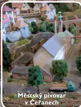
Městský pivovar v Čeřanech