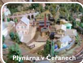
Plynárna v Čeřanech