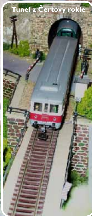
Tunel z Čertovy rokle