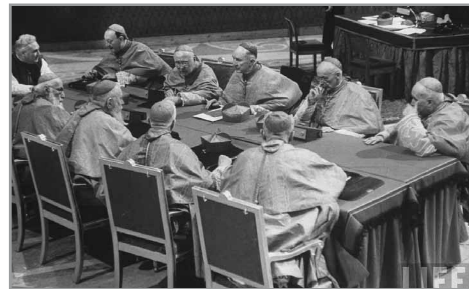
Jednání kardinálů během 2. vatikánského koncilu