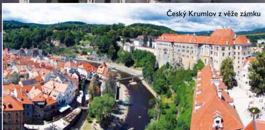
Český Krumlov z věže zámku

Město bylo postaveno na bezpečném místě obklopeném vodou a velice rychle se rozrostlo. Ovšem v okamžiku, kdy obsadilo celý poloostrov se jeho růst zastavil a díky tomu nám dodnes zůstalo ve své středověké podobě. Po Praze je Český Krumlov určitě druhým nejzajímavějším městem v Čechách a v létě se v něm snadněji domluvíte japonsky a anglicky než česky. Město, plné nádherných domů a křivolakých uliček korunuje ohromný hrad. Zvukovou kulisu městu dodává ze tří stran řeka Vltava. Na jejích březích si můžete v pohodě půjčit člun nebo raft, sjet si pár jezů a na druhé straně města člun zase vrátit.