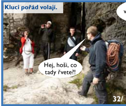
Kluci pořád volají.