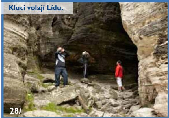
Kluci volají Lídu.