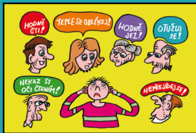
Ilustrace: Jiří Vancura

Radu dobře míněná se může často minout účinkem, protože druhého člověka neznáme tak dobře, abychom vždycky vhodně poradili. A přesto se nás může někdo zeptat: „Co bys mi poradil na začátku nového roku? Jaké si mám dát předsevzetí?“