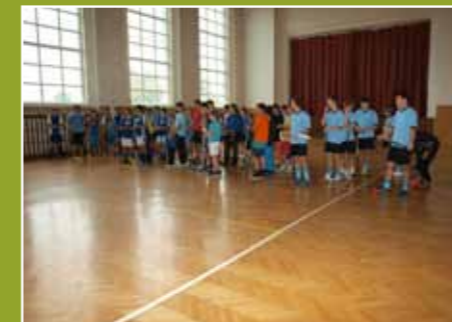
Budoucí mistři ve florbalu