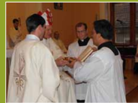
Autor článku se stává akolytou

Po 1. ročníku jsme trávili 14 dní s mládeží – na setkáních mládeže, na ministrantských táborech apod., 2. ročník nás zavalil do hospiců, nemocnic či domů s pečovatelskou službou. Třetí si našli nějakou 14denní práci, brigádu „na plný úvazek“, a čtvrtý ročník už s sebou nese dva týdny v nějaké živé farnosti, abychom zjistili, jak na to. Už se to blíží!