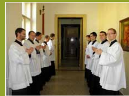
Třetí ročník už se těší na kandidaturu

8. září letošního roku se na Velehradě olomoučtí bohoslovci sešli s ministranty téže diecéze na ministrantské pouti. Mezi našimi hosty byli i zástupci policie nebo armády, projeli jsme se na koloběžkách – to náhodou vůbec není špatný dopravní prostředek!