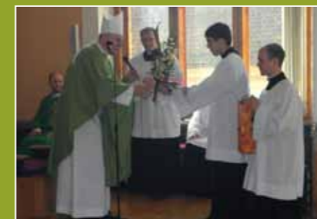
Brněnský otec biskup přijímá novokandiátské poděkování

V neděli s pěkným datem – 11. 11. – dorazily do semináře rodiny bohoslovců 3. ročníku. Ti byli totiž ten den přijati mezi kandidáty jáhenského a kněžského svěcení. Je to důležitá událost zhruba v půli