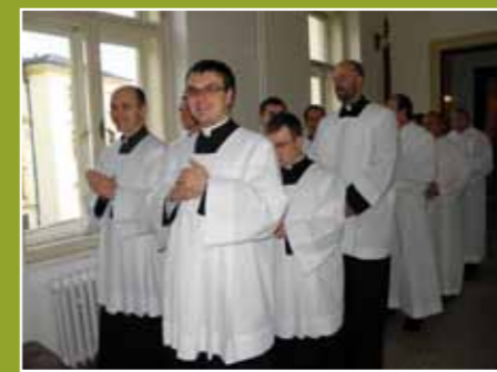
...a spolu s ním další čtvrtáci