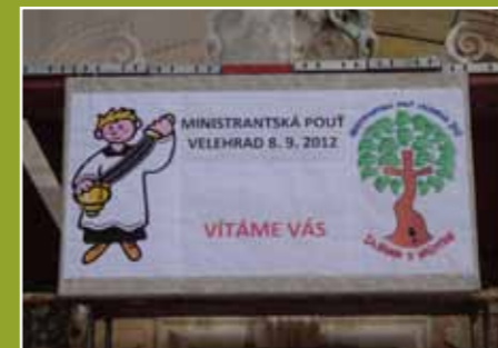
Takto zdravil ministranty Velehrad