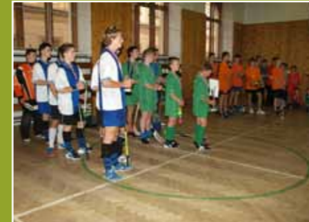
A teď už je známe

cesty za svěcením, v půli seminární formace. Někteří ji přirovnávají k zásnubám.