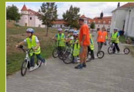
A takto se ministranti vydávají na cesty