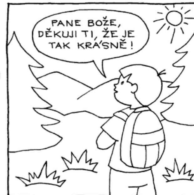
KDYKOLIV SI VZPOMENEŠ