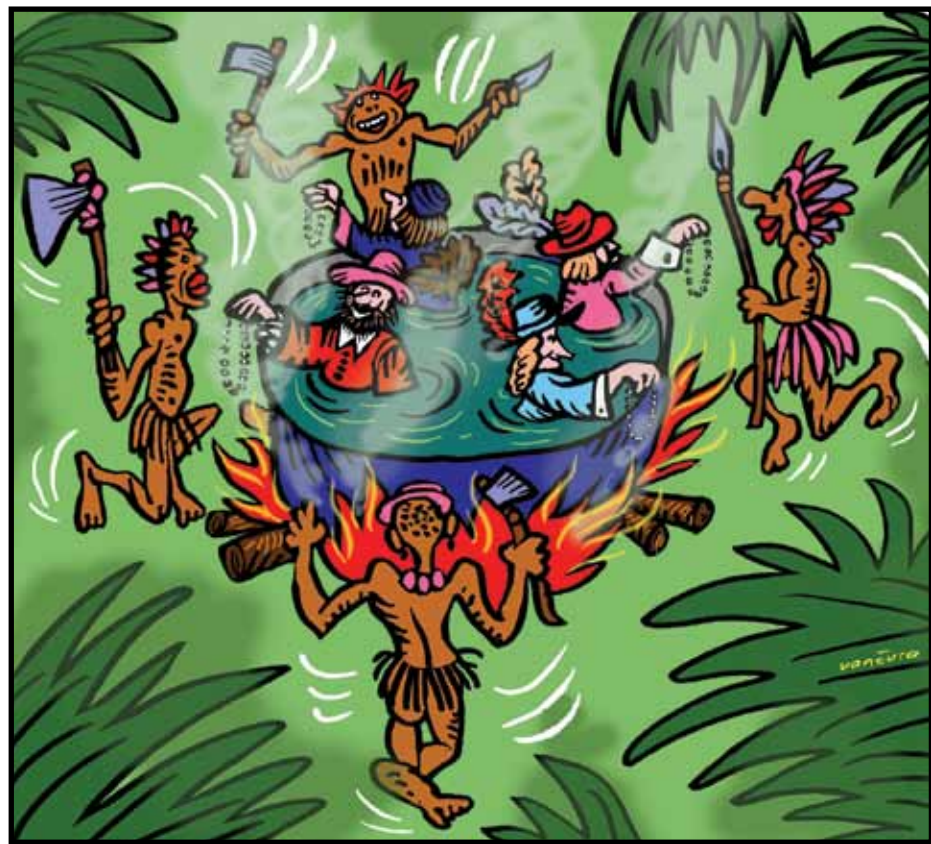
Ilustrace: Jirí Vančura