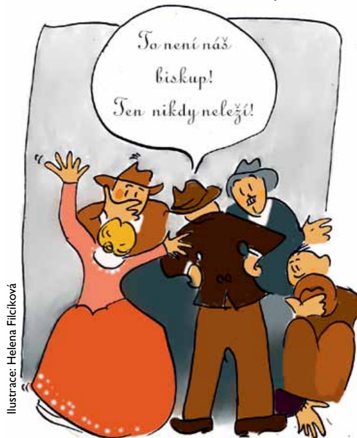
Ilustrace: Helena Filčíková