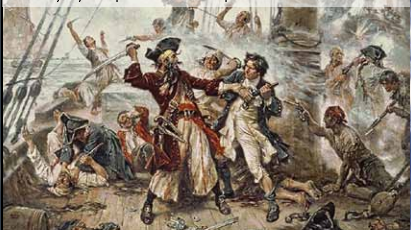
Nelitostný boj muže proti muži v čele s kapitánem Černovousem

Nám suchozemcům se může zdát, že doba krutých i hrdinných námořních lupičů je již dávno za námi a na piráty narazíme leda tak v kině. Realita je ovšem jiná a nutno dodat, že také výrazně méně romantická. V době občanské války se somálští rybáři trpící