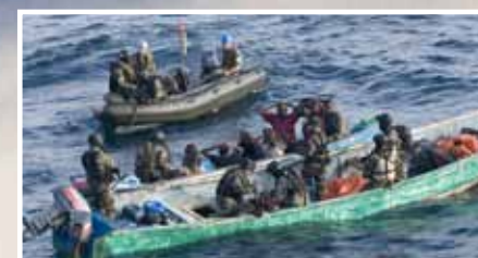
Mezinárodní jednotky zatýkají piráty

Krásné prázdniny a mnoho pirátských úspěchů :-) vám přeje Zbyněk