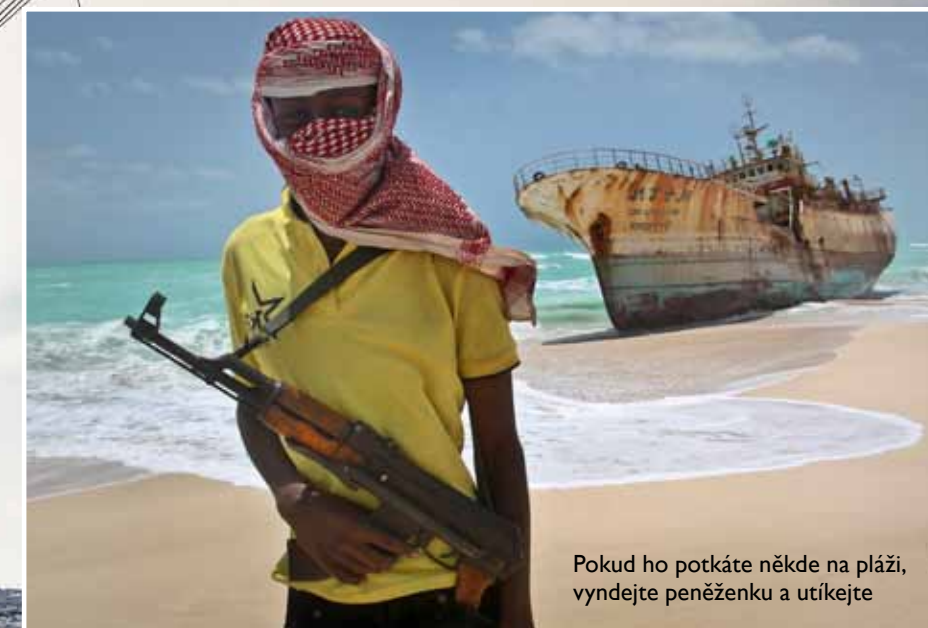
Pokud ho potkáte někde na pláži, vyndejte peněženku a utíkejte