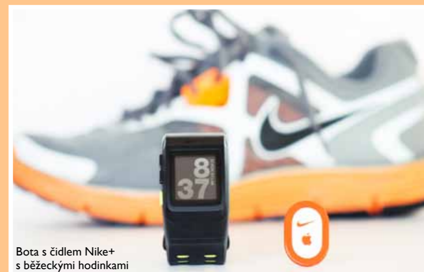
Bota s čidlem Nike+ s běžeckými hodinkami

Není to tak dlouho, co jsme na stránkách tohoto listu psali o novém vývoji vyspělé elektroniky, která se pomalu začíná přesouvat z našich pracovních stolů stále blíží a blíží k člověku. Hovořili jsme o chytrých brýlích a hodinkách, které zahájily novou éru takzvané nositelné technologie. Někoho možná napadne, že mobil už nosíme po kapsách pěknou řádku let, takže nic nového pod sluncem, a když jsme naposled s tátou stěhovali starou pračku, tak jsme si ji taky pěkně odnesli v rukách bez jakékoliv techniky.