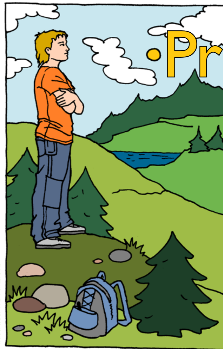
Ilustrace: Iva Fukalová

Pozor! Varování všem, kdo rádi čtou vtipy. Tento měsíc nám do redakce nikdo neposlal žádný vtip. Nejen, že jsme se ani nezasmáli, ale máme velké obavy, abyste se v příštích číslech zasmáli vy! Proto pošlete vtip a máte velkou šanci vyhrát nad vašimi lenošivými spoluministranty. Pro vítěze máme připravené Dobrodružství Matky Terezy, příběh, ve kterém zjistíte, že u Boha je opravdu možné vše.