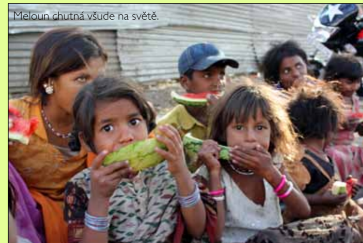
Meloun chutná všude na světě.

rychleji, než je rychlost chůze stoletého Inda ve sněhově bílém hábitu, kráčejiícího na svůj oblíbený přeslazený čaj s mlékem. Milovali jsme nepopsatelně pálivé pouliční jídlo. Dokonce i osolený meloun s chilli nebo osolený čaj s mlékem a chilli, po kterém jsme obvykle okamžitě stahovali kalhoty, protože pomsta je v Asii nezvykle rychlá, a navíc často doprovázená krátkodobou horečkou. O něco méně