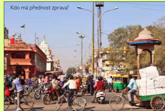
Kdo má přednost zprava?

To se mi poštětilo hned na další Cestě, kdy jsme s kamarádem cestovali stopem do Indie. Fáze nadšení nám vydržela celé dva měsíce. Cesta po zemi do Indie a Indie samotná nás naprosto okouzlili. Milovali jsme stopování pestrobarevných, nákladem přeložených nákladáků, jezdcích jen o málo