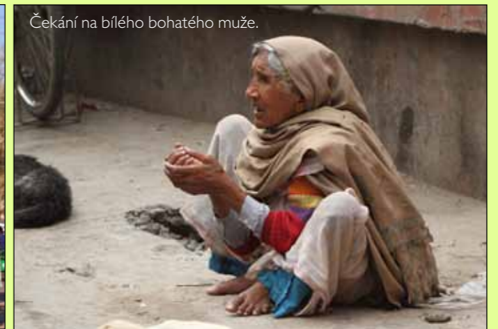
Čekání na bílého bohatého muže.

Jenže po dvou měsících nadšení se vše obrátilo. Dlouhodobé průjmy nás fyzicky vyčerpaly. Začalo nám vadit, že jídlo tolik pálí. Začalo nám vadit, že si nemůžeme v soukromí dojít na záchod. Ukřičená hudba nám začala být nes-