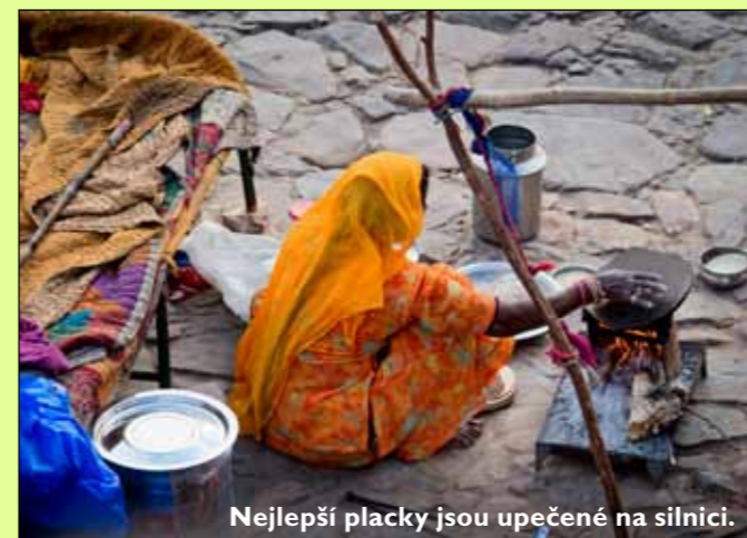
Nejllepší placky jsou upečené na silnici.

Na své další Cestě stopem po Indii (tentokrát jsem cestoval sám) se mi podařilo druhou fázi překonat a teprve potom jsem se konečně nechával pozvolna měnit. Nasytil jsem se Indií a nechával se pomalu, střízlivě, v klidu a dobrovolně „přepodstatňovat“. Teprve tehdy jsem se začal opravdu učit, odkrývat hlubší roviny jiné kultury, které nejsou na první pohled vidět pod palbou povrchních přebarvených vjemů. Indie se konečně dostala do mého nitra a otevřela mi zcela nový horizont vnímání světa. Najednou jsem znal dvě odlišné kultury a byl tak schopen dívat se na svět z různých kulturně podmíněných úhlů. Byl to osvobozující pocit. Když tedy cestovatel překoná druhou fázi, dostaví se odměna a Cesta dostane nový, hlubší smysl. Cesta začne odhalovat život. Cestovatel zakouší totéž, co doposud, ale už z toho není ani euforicky nadšen, ani k tomu necítí odpor a nechuť. Prostě vše přijme tak, jak to ve skutečnosti je, a začne pomalu vnímat okolní svět skrze program dané kultury. To, co mu dříve připadalo nechutné (třeba, že krásná dívka obědvající vedle vás si velmi