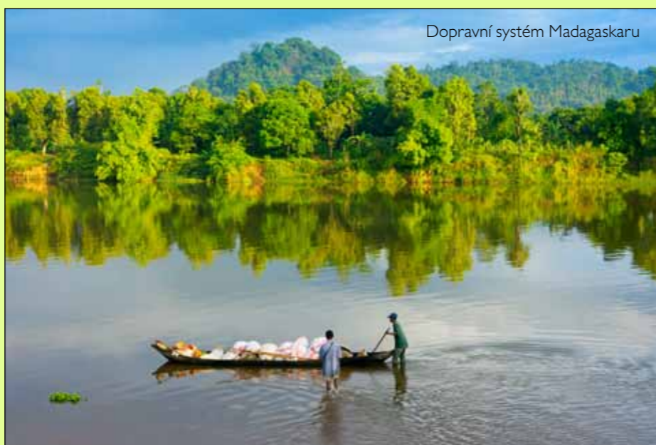
Dopravní systém Madagaskaru

Jak už jsem zmínil, celou procedurou kulturního šoku jsem hned dvakrát prošel v Africe. Prvním kulturním šokem jsme s mojí budoucí manželkou prošli v subsaharské Africe, kde jsme pobývali rok. Stopem a pěšky jsme pomalu cestovali okolo celého černého kontinentu a postupně se střetávali s mnoha z našeho pohledu nepochopitelnými kulturami. Ze začátku jsme odlišné kultury poměřovali tou naší domáčkou, kterou jsme považovali za směrodatnou. Sociologové tento přístup označují jako etnocentrismus. Postupně jsme ale přestali považovat svou rodnou kulturu za směrodatnou a pochopili jsme, že každá kultura je jiná a každá má nezcižitelné právo na svébytnost. Žádná kultura není „ta správná“. Tomuto postoji sociologové říkají kulturní relativismus. Po projití všech fází kulturního