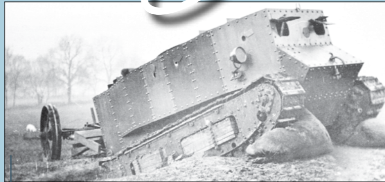
Foto: U.S. Air Force, U.S. Navy, imgur.com, Public Domain Zdroje: kniha Guinness World Records 2016

Ahoj ministranti, tentokrát si představíme ryze chlapské téma. Přestože i ženy někdy hrály a hrají ve válkách a bitvách zásadní role, můžeme říci, že válčení je především mužskou záležitostí. Armády a vojenská střetnutí však nejsou pouze záležitostí lidí. Veledůležitou roli v nich po celá staletí hraje i vojenská technika, která v posledních sto letech prodělala zásadní pokrok.