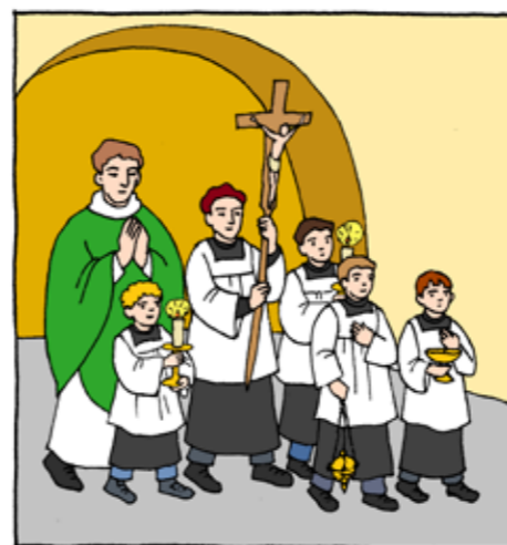
ilustrovala: Iva Fukalová

V tajence si můžeš vyluštit, jak se nazývá vyprávění o utrpení a smrti Ježíše Krista.