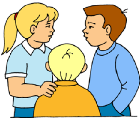
Ilustrace dvoustrany: Iva Fukalová