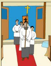
Ilustrace: Vojtěch Diehl

Ahoj kluci. Měsíc březen začal a s ním začala i doba postní. Možná si říkáte, že půst stojí za houby. Člověk si musí něco odříct. Musíme si dát nějaké předsevzetí, a to je těžké.