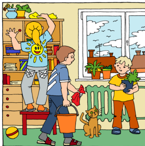
Děti pomáhaly s jarním úklidem.