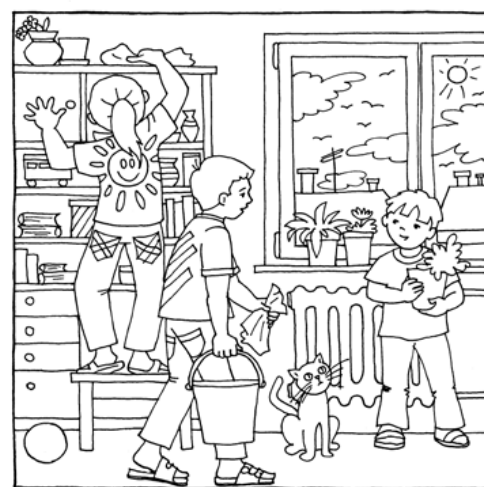
Najdeš deset rozdílů mezi obrázky?