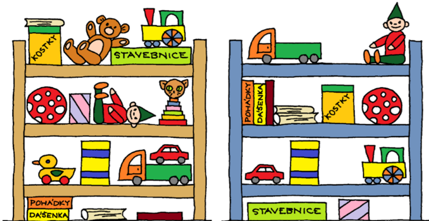
Ilustrace: Iva Fukalová

Tatínek natřel Honzíkovi nově poličku na hračky. Honzík si do ní hračky pěkně narovnal. Tři ale věnoval mladší sestřičce Klárce. Poznáš, které hračky Klárka dostala?