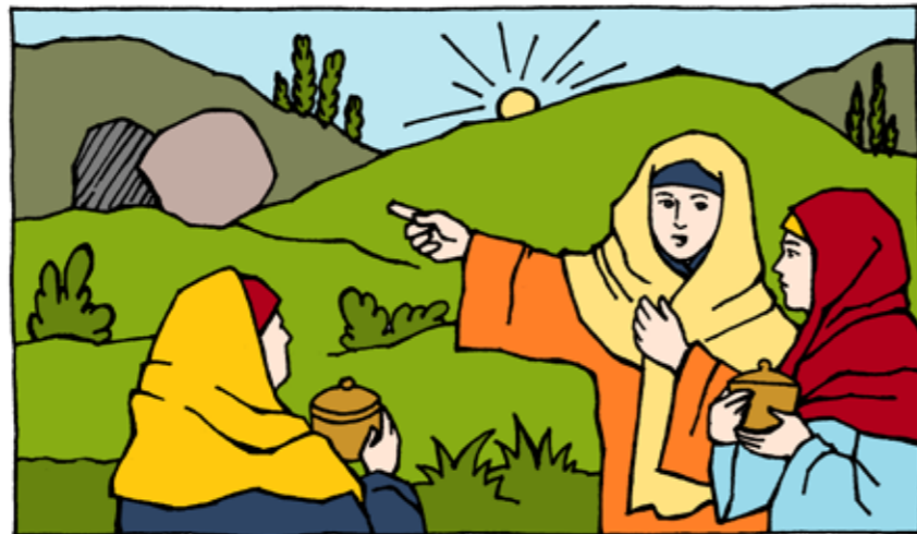
Ilustrace: Iva Fukalová

Najdi 10 rozdílů na obrázku u prázdného hrobu.