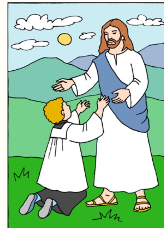
Ilustrace: Iva Fukalová

Jednoho známého vědce se ptali, jaký je rozdíl mezi časem a věčností. Vědec odpověděl: „Kdybch si udělal čas, abych vám to vysvětlil, potřebovali byste celou věčnost, abyste to pochopili.“