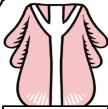
DOBA ADVENTNÍ A POSTNÍ, ALE I POHRBY