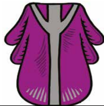
KVĚTNÁ NEDĚLE, VELKÝ PÁTEK, PŘI BOHOSLUŽBÁCH KE CTI DUCHA SVATÉHO A O SVÁTCÍCH MUČEDNÍKŮ