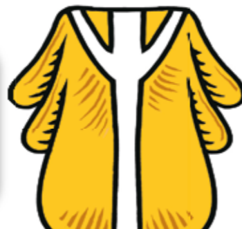
LITURGICKÉ MEZIDOBÍ – O NEDĚLÍCH A VŠEDNÍCH DNECH BĚHEM ROKU