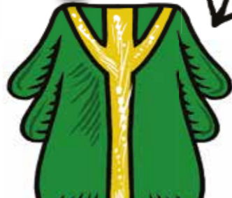
SLAVNOSTI A SVÁTKY, VÁNOCE A VELIKONOCE

Pomoz Tomovi dobře spojit správný text se správnou barvou ornátu!