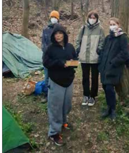
V bezdomovecké kolonii

me na ulici rozdat dary, které jsme dostali od lidí. Nám jde o to, přinést jim vztah, přátelství a kontakt s jinými lidmi, než kteří jsou v jejich bezprostředním okolí. Když začnete chodit na ulici, tak je to přátelství spíš přáním, ale po roce, kdy jste s nimi v častém kontaktu, už je to pravda.