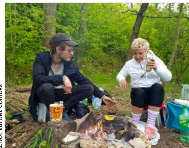
Život lidí bez domova

moudré se bavit s někým, kdo na lesní stezce vyleze ze stanu. My mezi ně nechodíme sami a scházíme se s větší skupinou lidí, kteří se navzájem znají a na nás nedají dopustit. A pokud jde o obavy, je dobře v druhém vidět sebe. My taky nemáme potřebu někomu bezdůvodně ubližovat. Navzdory všem předsudkům o lidech bez domova je třeba říct, že oni to mají stejně, nemají potřebu na někoho útočit. Ale někdo z nich může mít třeba problém s duševním zdravím, takže je třeba se chovat opatrně.