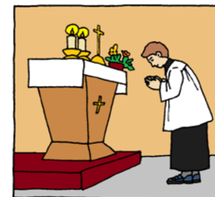
Ilustrace: Iva Fukalová

jsou prostředky, jak dojít k Pánu, k Bohu. Jakkmile se ale začneme radovat jen z věci samotné, ztratíme všechno. Protože věci se ztrácejí a mizí, a pokud nemáme cíl, tj. Boha, pak ztratíme všechno. Přeji vám každému, abyste se uměli radovat z darů, abyste v nich vždycky viděli Boží dobrotu a lásku, a hlavně to, že nás mají přivést k němu. Jak se takový dar nazývá, zjistíš v tajence.