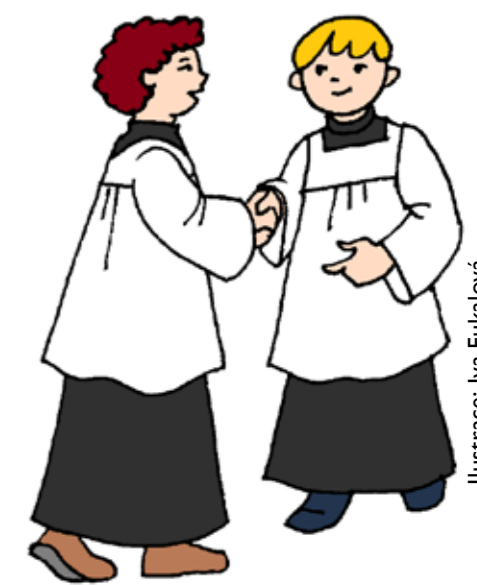
Ilustrace: Iva Fukalová

Bylo by dobré, abychom si všímali nových věcí kolem nás. Pak si uvědomíme, jak moc bereme spoustu věcí jako samozřejmost. Třeba to, že maminka vaří, uklízí, pere a žehlí (pokud nemáte sušičku). Táta opraví kohoutek, odveze něco nebo někoho, přiveze, vysaje v obýváku atd. Babička, děda a další lidé kolem nás dělají pro nás věci, které nejsou samozřejmé. Pak dokážeme poděkovat anebo poprosit. A to byste, chlapi, tedy měli. Maminka ani tatínek nejsou vaši služebníci, proto byste jim měli za všechno děkovat. Říct to kratičké slovo díky. A pak taky umět poprosit. Ne: „Mami, já mám hlad!“, ale „Maminko, neměla bys, prosím, něco k jídlu?“ Máma vás hladem nenechá, ale radost jí udělá i tato drobná změna v tom, jak si o to řeknete. Mám otázku! Která dvě slova jsou důležitá?