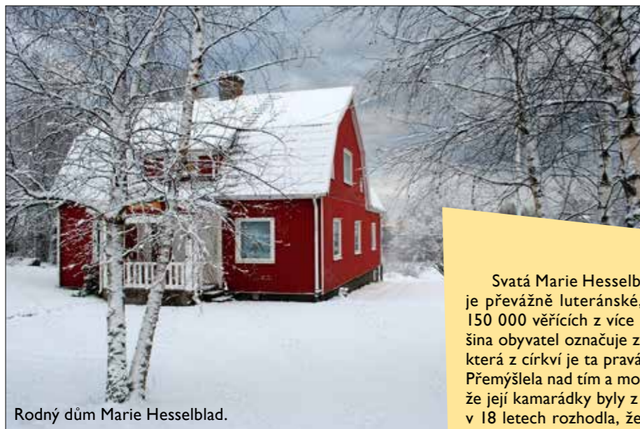
Rodný dům Marie Hesselblad.