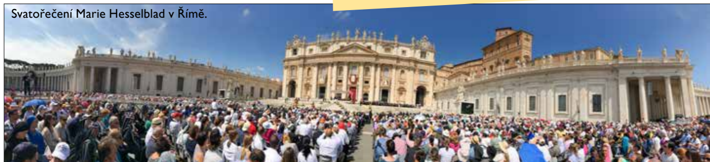
Svatořečení Marie Hesselblad v Římě.