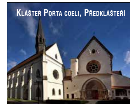
KLÁŠTER PORTA COELI, PŘEDKLÁŠTEŘÍ

Klášter sester trapistek ve vesničce Poličany byl vystaven doslova na zelené louce, přičemž stavba kláštera začala teprve roku 2008 – základní kámen tehdy zehnal kardinál Vlk. I když sestry trapistky žijí z odkazu svatého Benedikta každodenní práci a modlitbou, jejich pohostinnost a výrobky můžete zažít a ochutnat v domě pro hosty, který ke klášteru přiléhá. Ve volném čase se můžete vykoupat v nedaleké Slapské přehradě nebo navštívit malou vesničku Štětkovice. V ní místní mecenáš vybudoval park Drama věků, jehož součástí jsou i dětská hřiště. A v samotném centru obce pak naleznete dopravní hřiště s dětskou železnicí a modelářským domem. Filmoví fajnšmekři si přijdou na své v nedalekých Křečovicích, kde stále stojí brána JZD z filmu „Vesničko má středisková“. Krásu celé krajiny pak můžete přehlédnout z rozhledny Drahoušek na stejnojmenném kopci u vesnice Osečany.