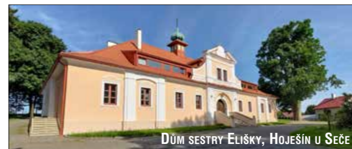
DŮM SESTRY ELIŠKY, HOJEŠÍN U SEČE

Jihočeská Štěkeň leží asi v polovině cesty mezi Pískem a Strakonícemi. Místní zámek obývá komunita sester Congregatio Jesu. Jejich zakladatelka, anglická sestra Mary Ward, postavila pravidla kongregace na jezuitské tradici sv. Ignáce z Loyoly. Zámek obklopuje rozlehlá zahrada se vzrostlými stromy. Současně přímo ve vesnici se mohou návštěvníci vykoupat pod splavem u vodáckého kempu. Spoustu možností skýtají i blízké Strakonice a Písek. Ve Strakonících lze navštívit muzeum motocyklů ČZ nebo se vyfotit u sochy Švandy Dudáka. V Písku je k vidění historické centrum i most přes řeku Otavu, který je nejstarším v Česku. Asi 5 km od kláštera navíc stojí památník vítězné husitské bitvy u Sudoměře včetně 16 m vysoké sochy Jana Žižky. Vzhledem ke všudypřítomným rybníkům, ale dejte pozor na komáry!