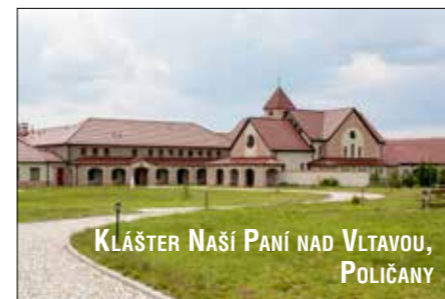
KLÁŠTER NAŠÍ PANÍ NAD VLTAVOU, POLIČANY

navštívit při různých příležitostech několik českých klášterů, v některých byl několik dní ubytovaný. Všechna ta místa přitom spojuje, že jsou zajímavá, i když se v Česku nejedná o ty turisticky nejvytíženější lokality. A také fakt, že všechny kláštery jsou kláštery ženských řádů. Pojďme si tedy o „krajínách klášterů“ povědět něco více!