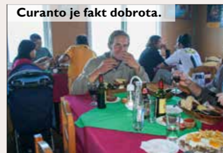
Curanto je fakt dobrota.

Na kontinentu jsme chvíli jeli po legendární dálnici zvané Pan-Americana spojující město Fairbanks na Aljašce a Quellon v jižním Chile. Po příjezdu do města jsem se srdečně rozloučil s řidičem, a ještě ten den autobusem zamířil do města Osorno, kde jsem přespal ve škarpě. Druhý den jsem se postavil se zdviženým palcem na silnici a zažil asi nejhorší stop v celé historii stopování. Pod sopku Puyehue vzdálenou 80 km jsem se s vypětím všech sil dostal skoro až v noci. Našel jsem si levné ubytování a padl do postele. Vyčerpaný po úmorné cestě jsem se dlouho převaloval; z pod ospalých víček jsem dlouho nemohl dostat obraz silnice ubíhající do nekonečna. Nakonec pomohlo jen počítání jihoamerických lam.