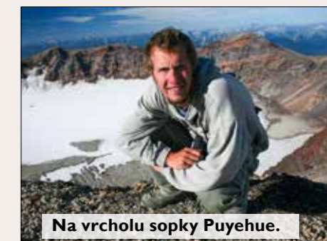
Na vrcholu sopky Puyehue.