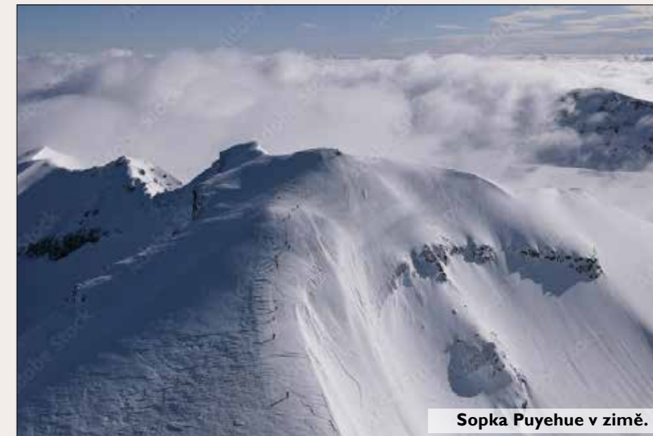
Sopka Puyehue v zimě.